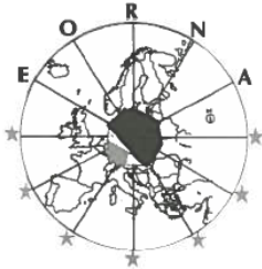
EUROPEAN OPERATING ROOM NURSES ASSOCIATION

Patrocínio e participação em encontros científicos de enfermagem e outras áreas da saúde.